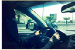
صورة تعبيرية من الانترنت

الذي أحببته، ثم فقدت عملي، ولكني مازلت يومياً أفصح عيني على المطار وعلى حركة الطائرات وهي تقادر بأمان وتعود بسلامة. ولأكثر من سنتين لم أترك مكاناً لم أبحث فيه عن عمل، وطرقت كل الأبواب، وناشدت المسؤولين من أجل إيجاد أي عمل لي في وظيفتي أو في وظيفة مقاربة. أريد أن أقدم ما أمك من خبرة ومهنية لـ "ديرتي"