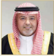
الشيخ خالد بن علي

وأعرب الشيخ خالد بن بالغ الشكر والتقدير لوزارة الأشغال وشؤون البلديات والتخطيط العمراني لدورها في تجهيز مقر محاكم العدالة الإصلاحية للأطفال، وكذلك للجهود التي بذلها المجلس الأعلى للقضاء، والهيئة العامة، والتي تكثفت بإنجاز هذا المشروع، وختاماً، نوه وزير العدل بالجهود المشتركة التي ساهمت في إعداد قانون العدالة الإصلاحية للأطفال وحمايتهم من سوء المعاملة، والذي جاء نتاج نقاشات معمقة شارك فيها مجلسا الشورى والنواب، ووزارة الداخلية، والمجلس الأعلى للقضاء، والهيئة العامة، وكذلك العمل والتنمية الاجتماعية، وكذلك المشاورات التي انعقدت مع مؤسسات المجتمع المدني خصوصاً المؤسسة الوطنية لحقوق الإنسان، إضافة إلى الخبرة الدولية التي تمت الاستعانة بها خصوصاً من المملكة المتحدة وكذلك مكتب الأمم المتحدة للمخدرات والجريمة.