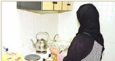
صورة تعبيرية لعامله منزلية