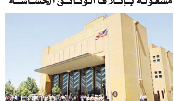
○ مبنى السفارة الأمريكية في كابول.

حققت حركة طالبان امس تقدماً ميدانياً جديداً في زحفها الراسم إلى إحكام قبضتها على عموم أفغانستان، وبيات على بعد كيلومترات معدودة عن العاصمة كابول. وبمساء امس بدأ القتال بين مقاتلي طالبان وقوات الجيش الأفغاني بمحيط مدينة مزار شريف عاصمة ولاية بلخ التي كانت الحركة قد أعلنت سعيها إلى السيطرة عليها. وبحسب الناطبة هدى أحمدى فإن طالبان سيطرت على مدينة شار أسباب التي تبعد نحو ١١ كيلومتراً عن كابول. وقالت أحمدى أيضاً إن المسلحين احتجزوا المسؤولين المحليين في المدينة، كما قالت حركة طالبان إنها سيطرت على مدينة أسد آباد عاصمة ولاية كونر، ومدينتي كران وسجان في ولاية بدخشان، ومدينة غارمز في ولاية بكتيا ومدينة شيرزاد في ولاية ننگرهار الأفغانية. وإفادت مصادر «العربية»، بأن قوات أفغانية هربت إلى داخل إقليم بلوستان الإيراني، وتحكم حركة طالبان سيطرتها على المناطق المحيطة بالعاصمة الأفغانية، ولا تبدي أي مؤشر إلى رغبة في إبطاء تقدمها. وأسرت سفارة الولايات المتحدة في كابول موظفيها بإتلاف الوثائق الحساسة والرموز الأمريكية التي يمكن أن تستخدمها طالبان لأغراض دعائية، مع اقتراع متطرفي الحركة من العاصمة الأفغانية. وترافقاً، بدأت طلائع القوات الأمريكية بالوصول إلى