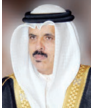
○ وزير التربية

اعتمد وزير التربية والتعليم الدكتور ماجد بن علي النعيمي نتائج تخصيص البعثات والمنح الدراسية لعام الدراسي ٢٠٢١-٢٠٢٢، وقد رفعت إليه من الجهة المختصة بالوزارة، بعد أن تم الانتهاء من كل الإجراءات المتعلقة بذلك، مشيداً بدعم وريادة القيادة الحكومية، لما تقدمه من دعم ومساعدة متواصلين للوزارة، بما يمكنها من تقديم أفضل الخدمات التعليمية للطلبة في مختلف المراحل التعليمية. وقال إن عدد الطلبة المتفوقين الذين استفادوا من البعثات والمنح الدراسية لهذا العام بلغ ٣٧٥٣ طالباً وطالبة من المدارس الحكومية، وعدد حاصلين على معدل تراكمي ٩٥، كما فوق منهم ٢١ طالباً من التعليم الفني والمهني، أما المستفيدين