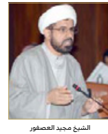
الشيخ محمد العصفور