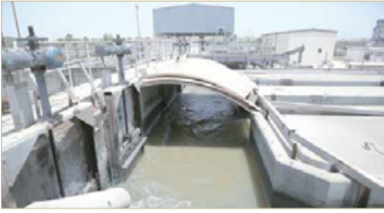
محطة المجاري في توبلي (صورة إرشيفية)

عالية، حيث لا يعاني القاطنون في محيطها وتحياتنا لما تبذله وزاراتكم من جهود في سبيل لهذه المشكلة حفاظاً على سلامتنا وسلامة تطوير البنية التحتية في مملكتنا الحبيبة.